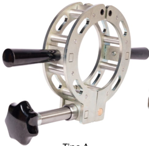
Tipo A (con bisagras)